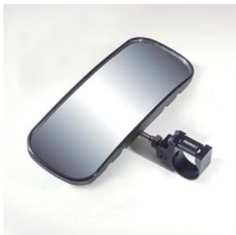
VÁLIDO PARA CUALQUIER MODELO YXZ1000

NOTA: Perforación del techo requerida para la instalación